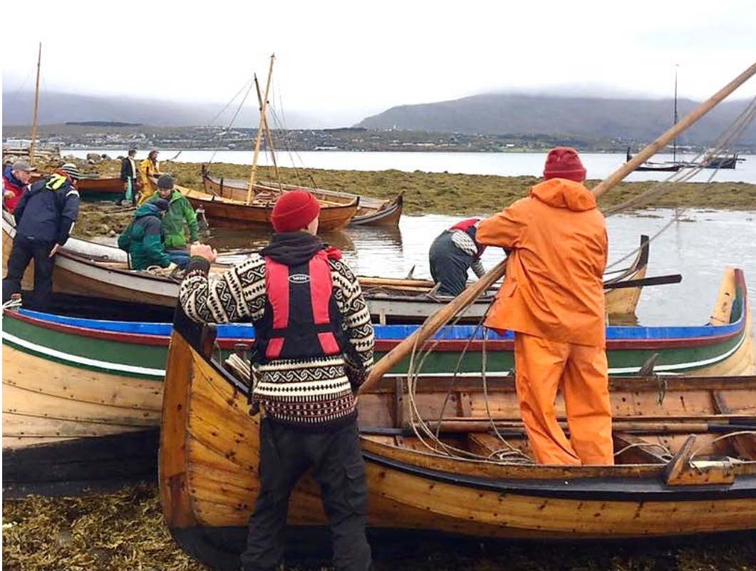
Råseilseminaret fredag 15. september 2017.

sang og sosialt samvær. Søndag var det avreise ut på dagen og mange fornøyde deltakere fikk en smak av kveita med seg hjem som et minne fra det rause nord.