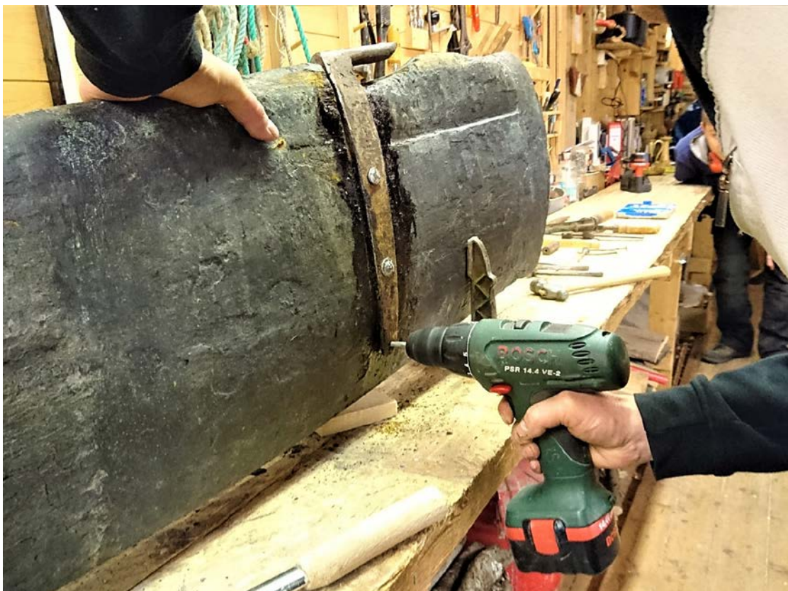
Reparasjon av roret, ny hengsel.

Vårarbeidet bestod av sjekk av matkister, dregger og kjettinger. Dreggen ble dekt med en linestamp og det ble klargjort for bendsling av hangerten som etter fjorårets seilas viste seg å trenge ny. Videre ble alle nagler skiftet. Roret fikk ny hengsel da den gamle var så slitt at det var vanskelig å få av styret. Før utsett ble båten skrapet og smurt. Vi hadde ikke fått tak i black varnish så det er bestemt å bruke moderne primer før bunnsmurning.