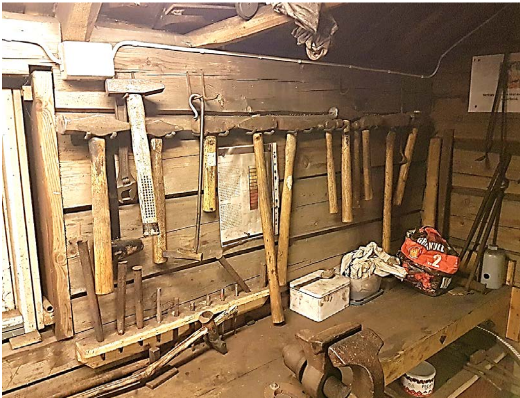
Et utvalg av hammer, dorer, meisler og annet verktøy i smia.

Det har vært år med litt laber aktivitet i gruppa på det jevne, men vi har noen få aktive medlemmer som har brukt smia en del. Vi har også gjort noen tiltak for å bedre arbeidsforholdene i smia og det har blitt bedre. Det som hjalp mest var å forlenge røykrøret og montere inn ei ekstra vifte. Det er fortsatt en del arbeid å gjøre på dette feltet og det er ønskelig å flytte vifta ut for å redusere støyen i smia. Vi får se hva vi kan klare å få gjort i løpet av 2018. Det er også behov for å lage en del verktøy til smia og da tenger spesielt.