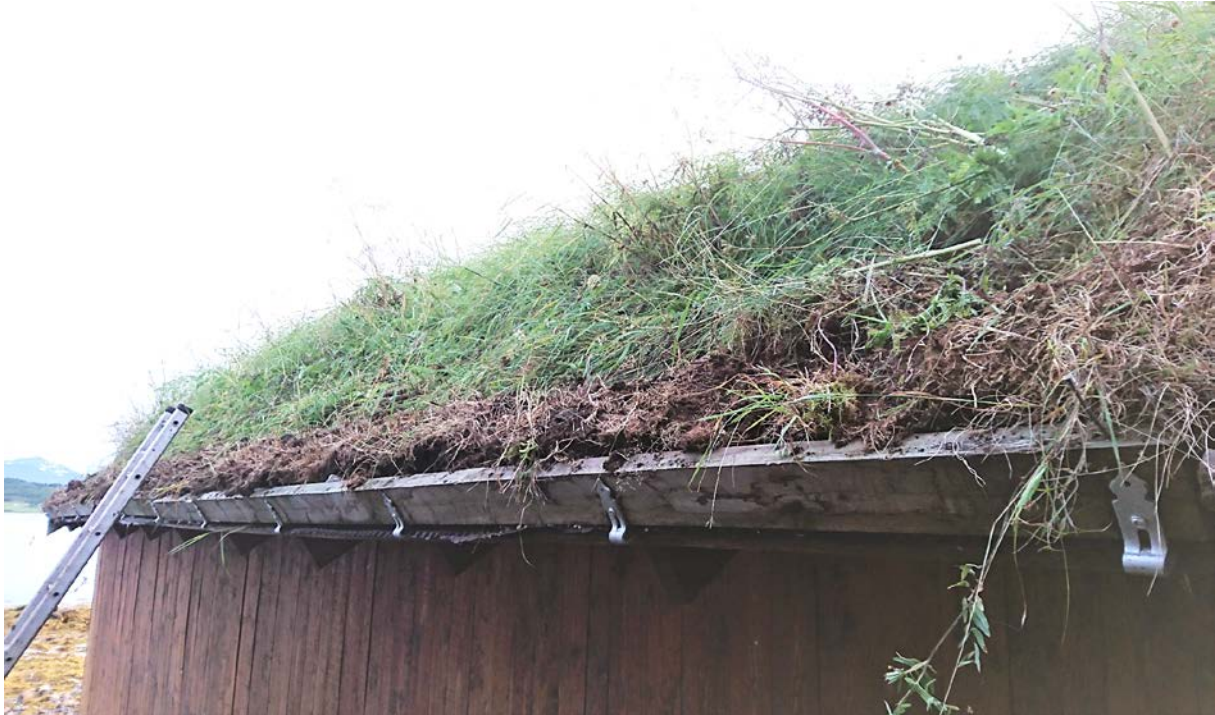
Nye torvhalskroker på «nynaustet».