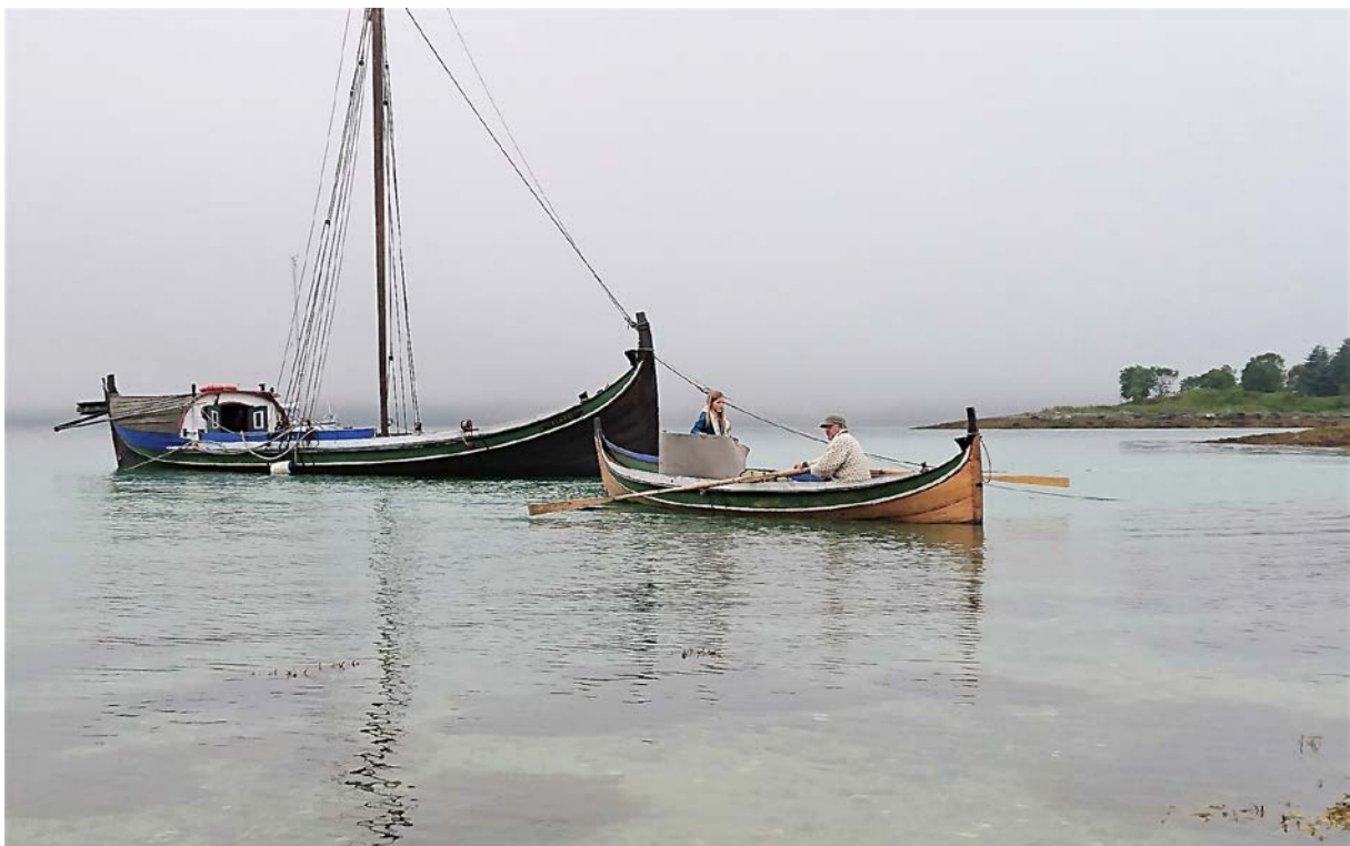
Høsttur til Nipøya i le av Sandholmen.

Den 19.-20-august var det igjen høsttur til Nipøya, i år med 12 deltakere fra 6 mnd. til 60 år. Det deltok to båter. En riktig hyggelig tur selv om det ikke ble store seilassen. Pga sur nordavind la vi oss ikke på Nipøya, men i le på Sandholmen. Det ble organisert Rusken aksjon, da Sandholmen var full av maritimt søppel. Lørdag var en flott dag og alle koste seg rundt leirbålet. Hjemturen på søndag ble det motorgange til Finnvika og seilas videre til Håkøya, god og flott vind på slutten selv om det ble mye regn innen vi kom til kai.