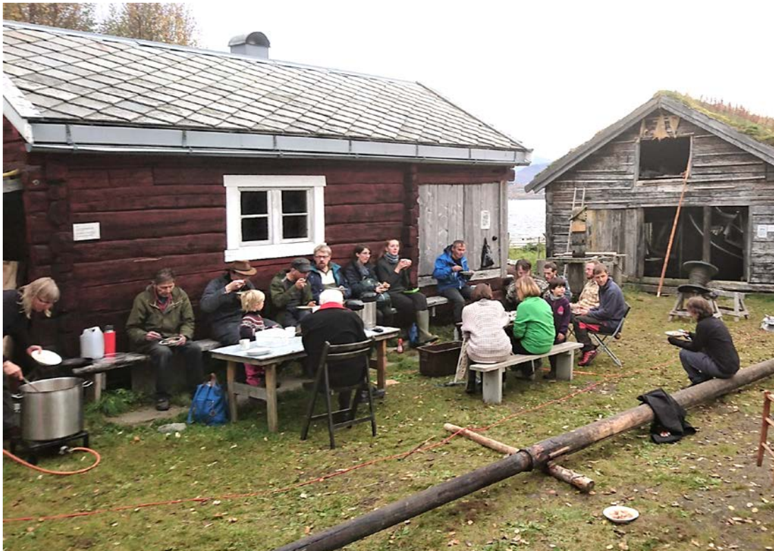
Kjøttsuppa på innsettardagen 23.september.

På innsettardagen den 23 september ble det servert ei mettende saltkjøtt/knokegryte på Stakken.