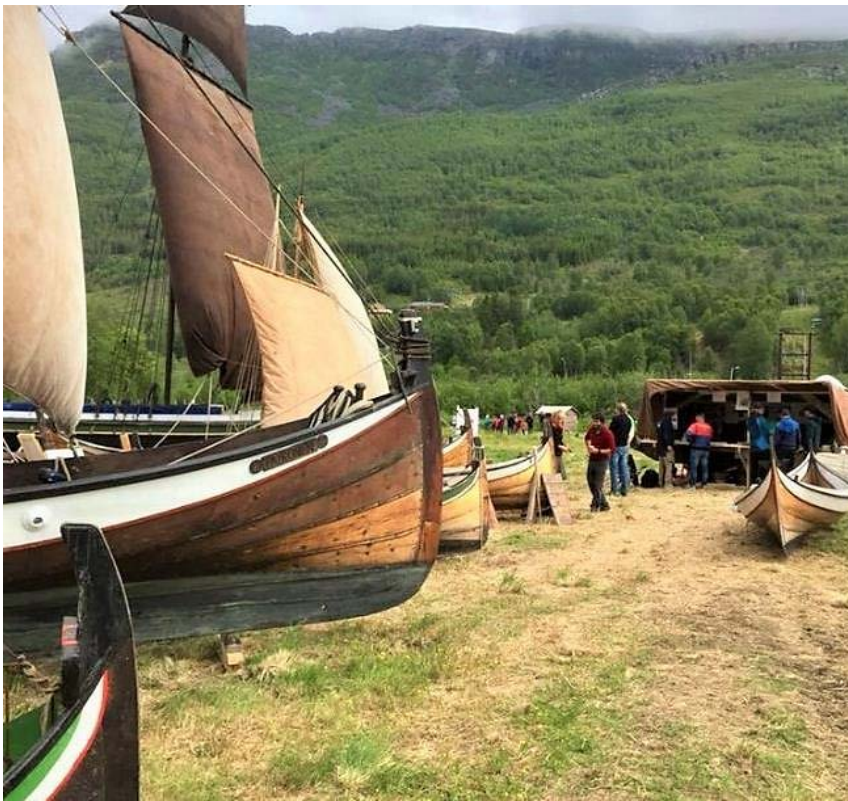
Deler av flåten på Riddusletta i Manndalen med informasjonsboden i bakgrunnen.

I juli deltok Arctandria med ca 10 medlemmer på urfolksfestivalen Riddu Riddu i Manndalen. Vi deltok med Salarøy og tre av foreningas mindre båter som ble stilt ut på sletta sammen med flere andre båter fra regionen. Her promoterte vi sammen med Forbundet kysten våre aktiviteter og vi solgte kalendere og bakte flatbrød som også kulturminister Trine Skei Grande fikk smake. Vi hadde hundrevis av besøkende hver dag på vår stand, og mange fikk en smak av kystkultur og en grunn til å bli med.