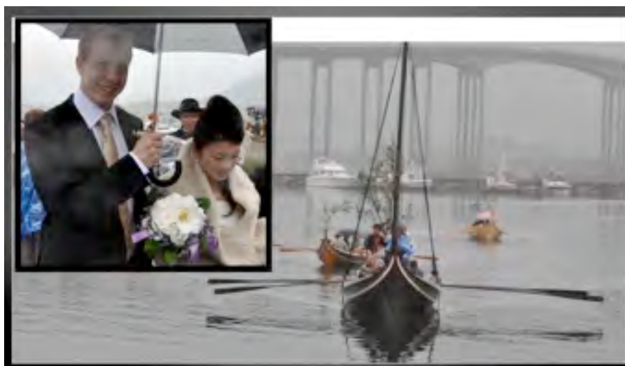
Fra arrangementet på indre havn – brudeferd – 5. september.

Folkemusikkgruppa i BUL hadde også et opplegg i forbindelse med Kulturminneåret 2009.