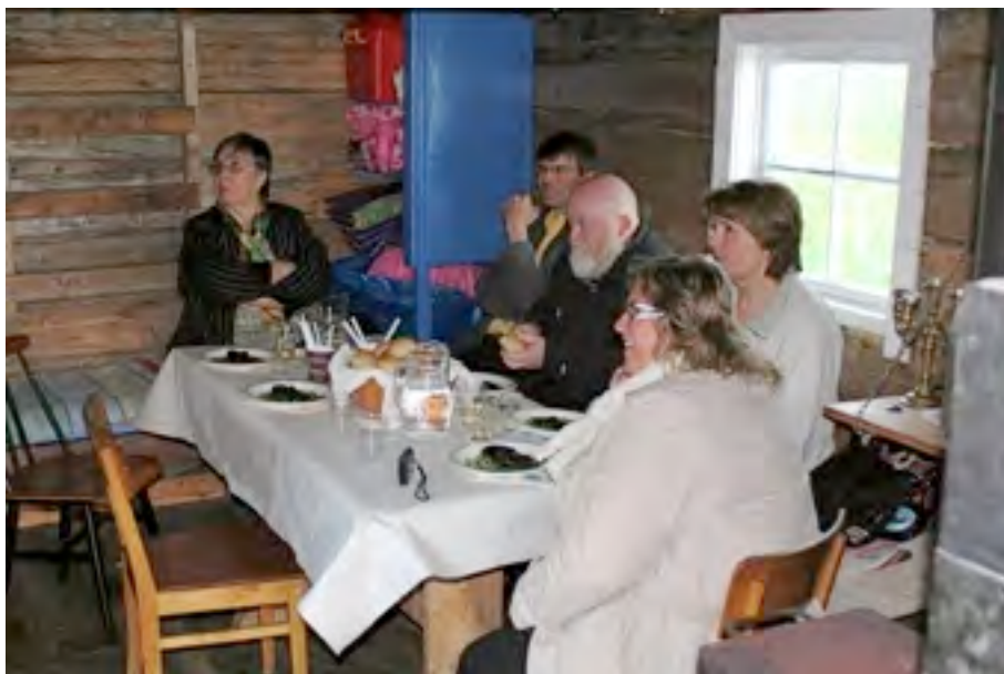
Kirkevergen i Gildeskål sammen med sine medarbeidere i Rorbua på Stakken