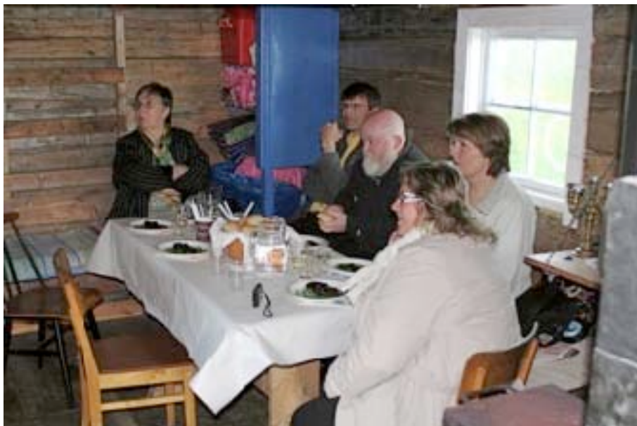
Kirkevergen i Gildeskål sammen med sine medarbeidere i Rorbua på Stakken