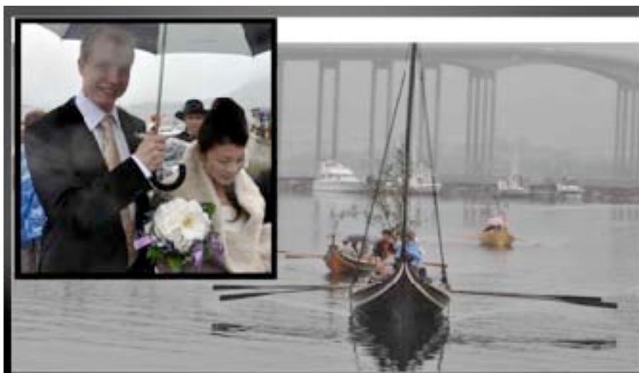
Fra arrangementet på indre havn – brudeferd – 5. september.

Folkemusikkgruppa i BUL hadde også et opplegg i forbindelse med Kulturminneåret 2009. Dette var et arrangement som gikk i Torghuken og på torget i Tromsø sentrum lørdag 5. september. Vi deltok med Håløygen og to seksringer, samt at vi hadde Salarøy liggende ved flytebygga. Opplegget fra vår side var å ro et brudepar inn til Torghuken. Vi brukte Håløygen til å ro brudeparet, mens brudens (japansk) og brudgommens forlovere med de to lands nasjonaldrakter ble rodd i seksringene. Fra Torghuken ble de kjørt med hest og karjol til Domkirken. Båtene ble hentet fra Kvaløya av et mannskap på 8 personer fra foreninga. I tillegg hadde vi stand på torvet som ble bemannet med 4 personer. Med transport av utstyr og lagning av deig til lefsene bisto enda flere av lagets medlemmer. Rapport om dette arrangementet er utarbeidet av BUL.