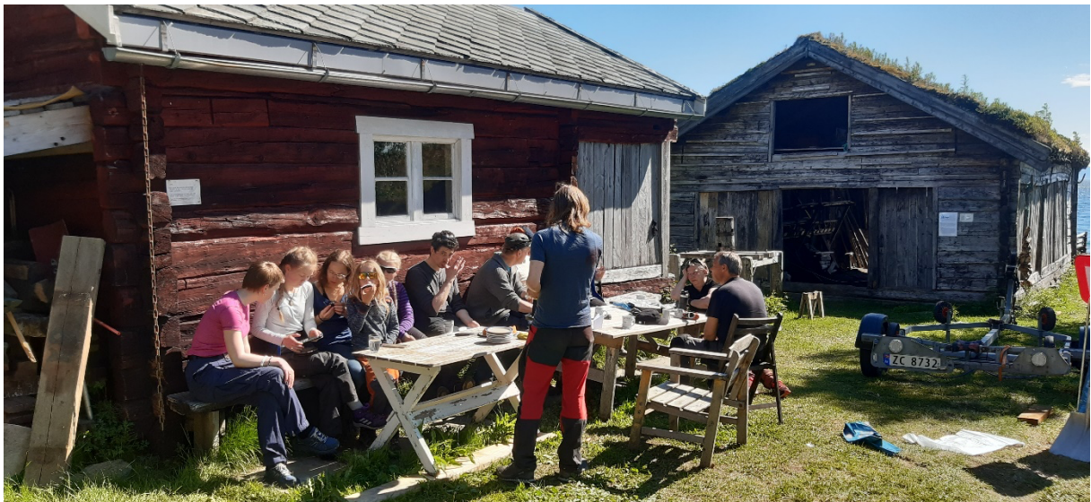
St. Hans feiring på Stakken

Tradisjonsmatgruppa har dukket opp med ujevne mellomrom og hatt ansvar for tillaging og servering av mølje i februar, rømmegrøt på St. Hansaften og før jul. I desember ble det arrangert flatbrødbaking en ettermiddag på Stakken.