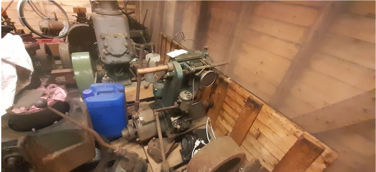
Noen av motorene fra Sotrøret