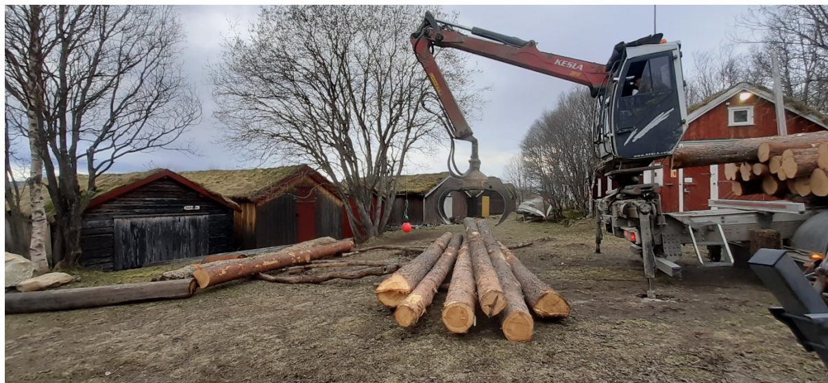
Tømmeret fra Dividalen.