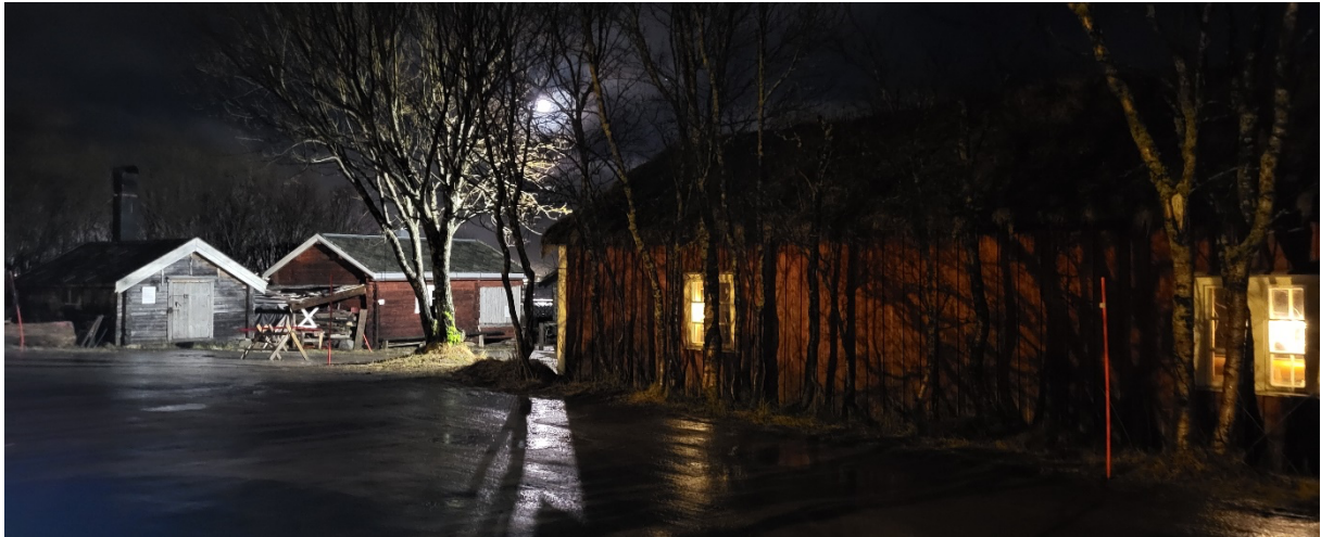
Natt over Stakken

Det har i 2022 heller ikke vært det store vedlikeholdet på bygninger på Stakken. Ingen fellesdugnad er heller utført, dette skyldes i stor grad «slitasjen» på styret og båtgruppa sin deltakelse i nedleggingen av Sotrøret i Tromsdalen.