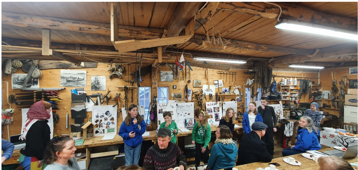
4H Høstfest med prosjektframvisning

Høstfesten var 23. oktober med utstilling av prosjektene. Det var 10 medlemmer som hadde prosjekt og alle fikk godkjent. Vi hadde kafe og loddsalg, 33 deltok på høstfesten inkludert medlemmer. Hilde Ovesen fra 4H-kontoret var høstfestrepresentant.