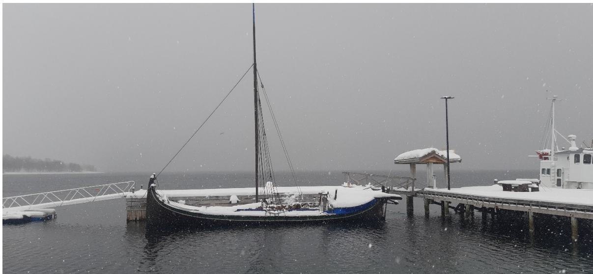
Salarøy i maisnø