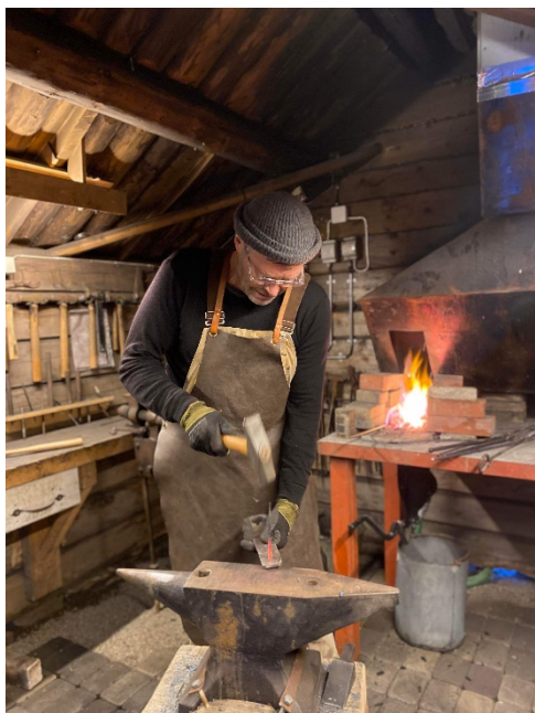
Smeden i arbeid